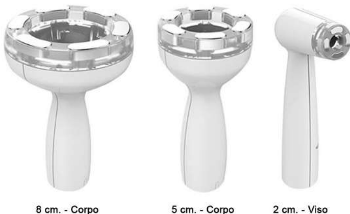
8 cm. - Corpo

Plug & Play, l'apparecchiatura riconosce e si adatta automaticamente al tipo di manipolo connesso. Gli elettrodi in acciaio di alta qualità garantiscono un calore uniforme e nessuno shock elettrico al Vs. paziente.