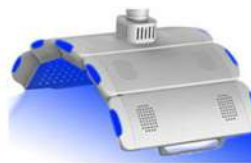
LUCE BLU 417NM

Efficace nel trattamento delle acne, reagisce con il cromoforo (protoporfirine) attraverso la produzione intercellulare di un singoletto O 2 capace di eliminare il batterio che le genera. La luce svolge azioni antibatteriche, antiallergiche, antinfiammatorie, sebo normalizzanti.