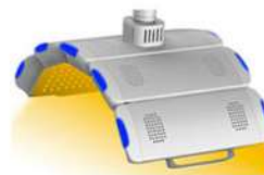
LUCE GIALLA 590NM

La luce gialla penetra in modo meno significativo nella cute rispetto alla luce rossa ed IR. Senza effetto termico, nei fototipi più chiari, questa lunghezza d'onda può attenuare alcuni segni di foto-invecchiamento ed ha un effetto antiinfiammatorio nelle flogosi acute.