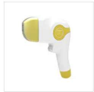
755 + 808 + 1064nm