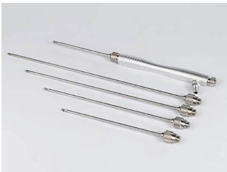
Cannule Liposuzione Lifting