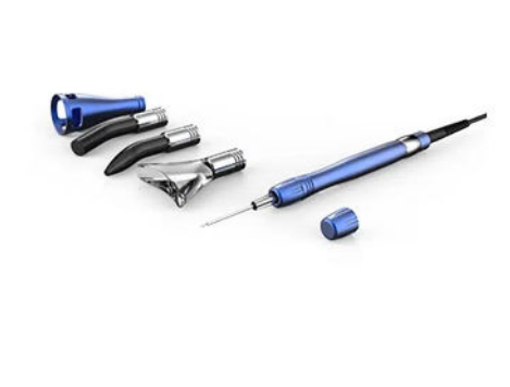
Manipoli per Odontoiatria