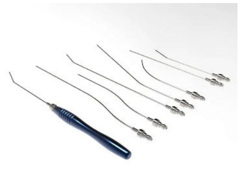
Cannule Liposuzione Lifting