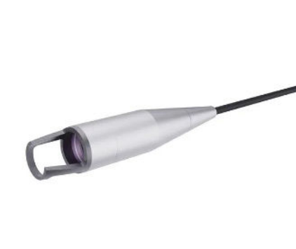
Cannule Liposuzione Lifting